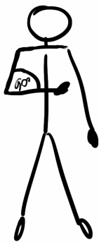
Jooni 2. Käsi viskeliigutuse ajal.

Sama tee nüüd kettaga, kuid lisa kiirendus. See tähendab, et viske liigutus algab rahulikult ning lõpeb plahvatusega. Harjuta, kuni tunned, et ketas lendab ise käest ära. Kui selle saavutad, saavutad ka täpsuse.